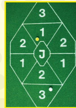
Team B spielt den ersten gelben Ball